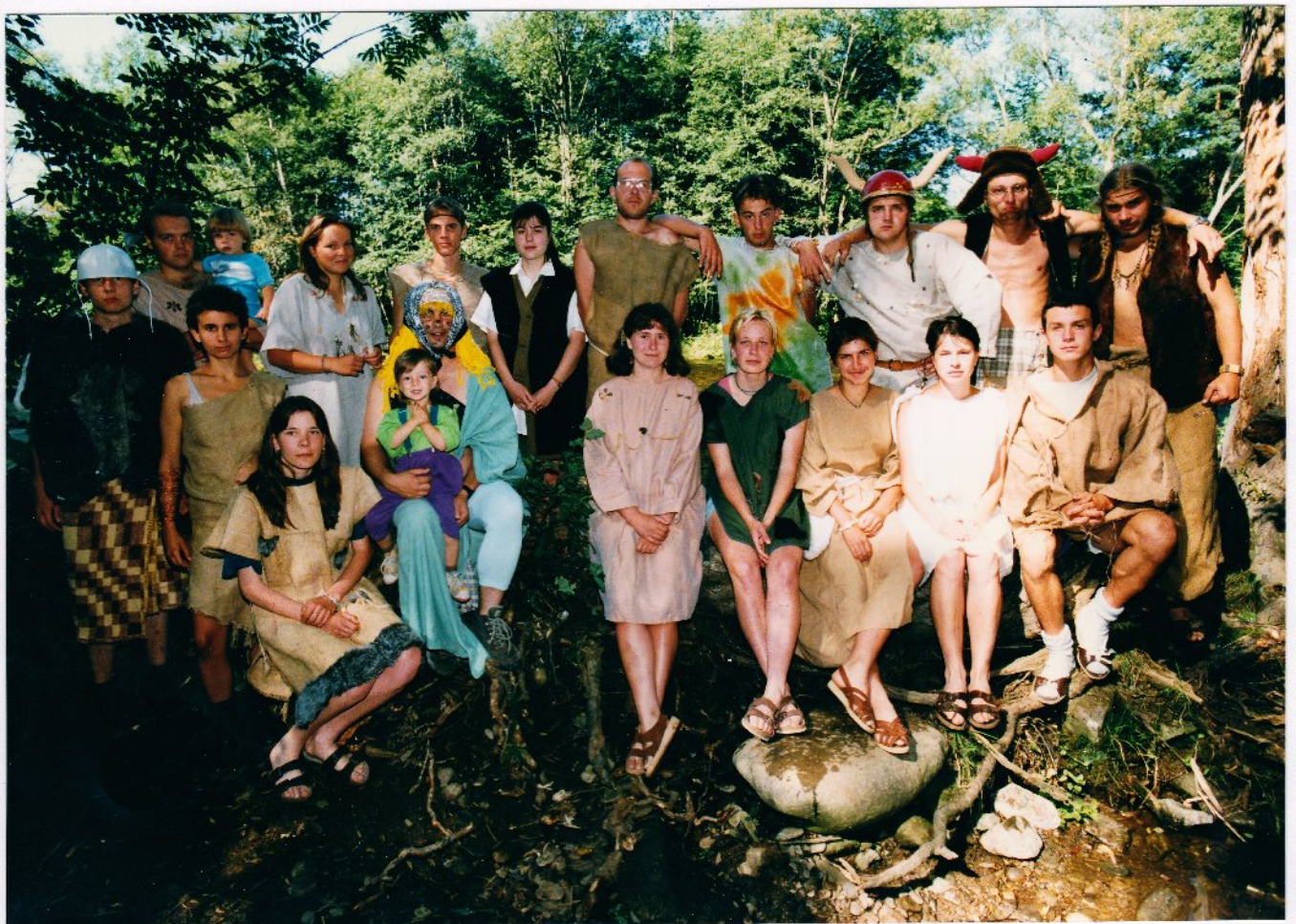
Hlavy klanů s pomocníky