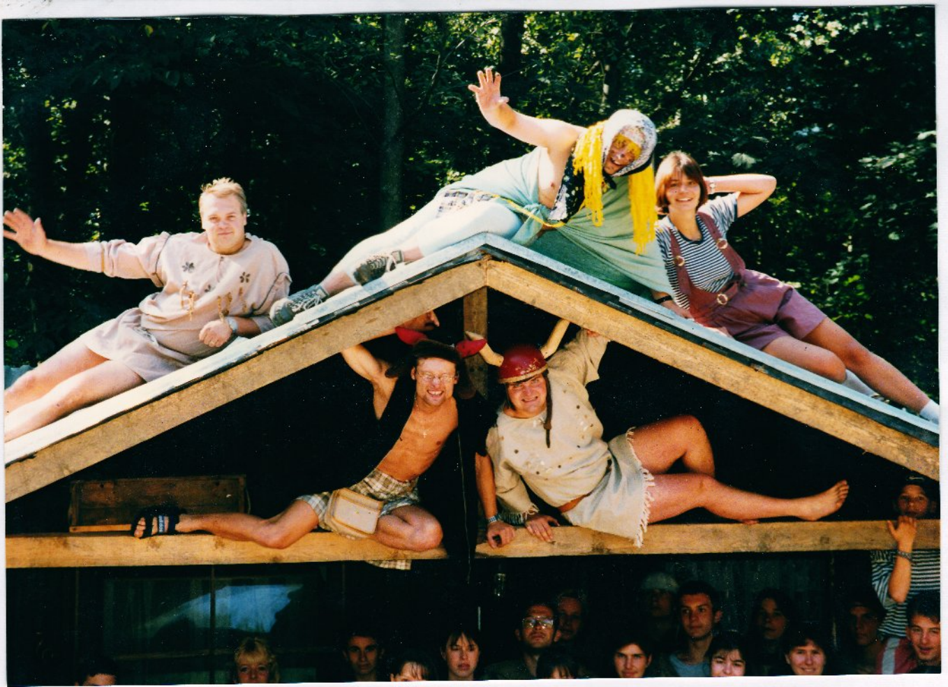
Zátiší s naším MÁGEM před proměnou